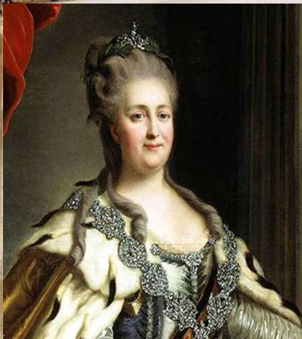
Екатерина II 1762-1796

По указу царицы Екатерины II в 1784 года тарханам - татарам и башкирским мурзам предоставлялись привилегии и присваивалось дворянское звание, если последние могли доказать свою родословную и наличие Царской грамоты на тарханство.