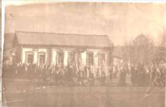
Жители Старопохвистнева на демонстрации. Колхоз «Боевик»