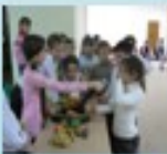
Создание таблиц в начальной школе