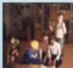
Создание таблиц в начальной школе