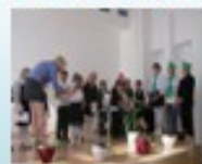
Праздник «По сказочке в сказочный дом»