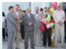
Вручение благодарственного письма

Социальное партнерство на открытии новой школы